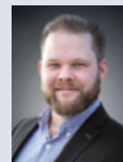
Moritz Beck Memacon GmbH