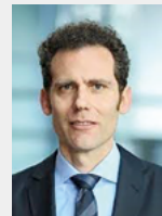
Maik Schäfer Bundeszentralamt für Steuern