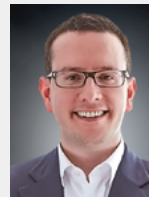
Dr. Sebastian M. Klenk Star Cooperation GmbH