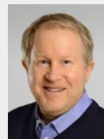
Matthias Lehrke Lehrke Verlag GmbH