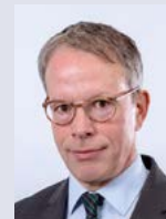
Dr. Frank Sterner Diehl Stiftung & Co. KG