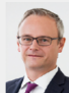
Martin A. Ahlhaus Noerr LLP