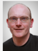
Thomas Kipp Miele & Cie. KG