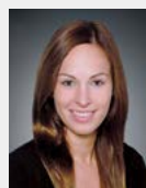
Sina vom Knappen