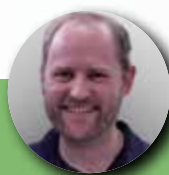
Michael Staudinger BSH Hausgeräte GmbH