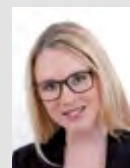
Eva Natalia Resch Kienbaum Consultants International GmbH

Hoher Lernerfolg durch begrenzte Teilnehmerzahl!