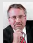
Thomas Hartmann Kienbaum Consultants International GmbH