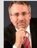
Thomas Hartmann Kienbaum Consultants International GmbH