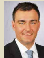
Jürgen Rismondo Robert Bosch GmbH