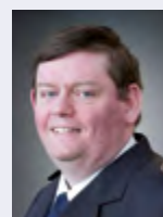
Andreas Rudlof Flughafen Stuttgart GmbH